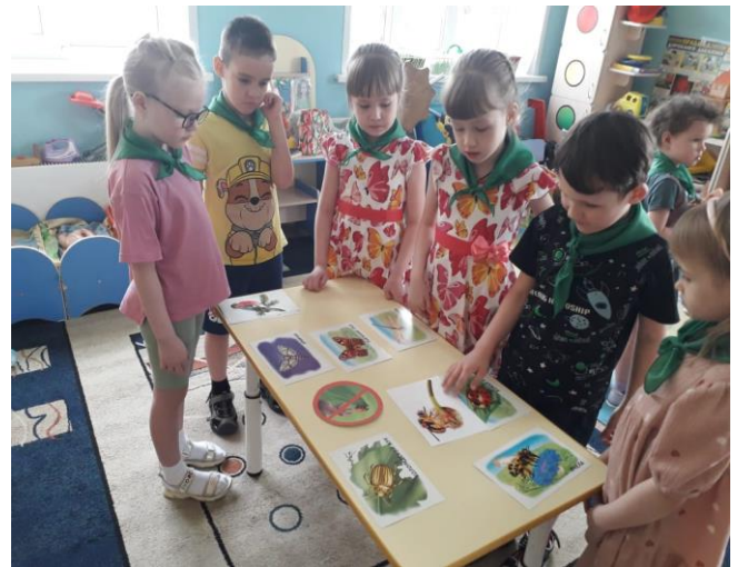
Выполняли задание "Найди с какого дерева лист"