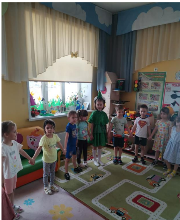
Физминутка, «Здравствуй лес»