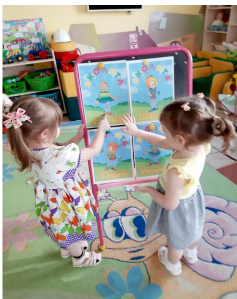
Знакомство с Эколятами

Во второй группе младшего возраста «Пчёлки» педагоги организовали выставку Эколят «Окружающий мир». Дети рассматривали иллюстрации для расширения знаний об окружающем мире. Педагоги предложили рассмотреть иллюстрации Эколят – молодых защитников природы, познакомили детей с весёлыми сказочными героями - это жёлуди, каждый со своим характером, но они очень любят природу и заботятся о ней. Жёлуди дружат с Ёлочкой. У каждого героя есть свой костюм, по которому его узнают дошкольники. Они берегут и охраняют лес, заботятся о его обитателях, помогают детям ближе узнать Природу, подружиться с ней и полюбить её. Для закрепления показали мультфильм как Эколята в лесу сделали много добрых дел (собрали мусор в мешки, подняли птенцов в гнездо, потушили огонь). Дети эмоционально отнеслись к происходящему в лесу, а когда Эколята навели в лесу порядок дети пообещали, что тоже будут беречь природу. Во вторую половину дня педагоги организовали ООД «Бабушкины сказки», цель которого формирование экологически грамотного поведения, бережного отношения к природе. В гости к детям приходила бабушка, показала настольный театр. Рассказала о маленьких человечках, которые живут в лесу, рассказала, как их зовут и как они научили правилам поведения в лесу двух друзей волчёнка и медвежонка, которые гуляя в лесу, кушали конфеты, а фантики бросали на полянку. Дети вместе с эколятами убрали мусор с полянки. Ответственные воспитатели Е.И.Скулкина, О.Н.Табатчикова.