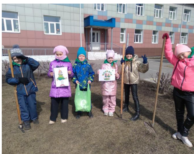
Субботник "Каждую соринку – в корзинку!"