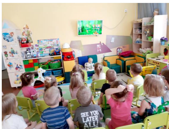
Просмотр мультфильма «Эколята – молодые защитники природы»