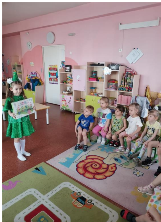
Беседа о правилах поведения на природе

В средней группе: «Лимпопо» педагоги организовали ООД лепка (коллективная работа) «Берегите лес!». Цель, которого воспитание любви к природе; умение работать дружно, коллективно. Была проведена беседа: «Для чего нужны деревья». Дети узнали, что деревья очищают и увлажняют воздух, создают прохладу, некоторые – дают вкусные, съедобные плоды. Спеленное дерево - это строительный материал: из