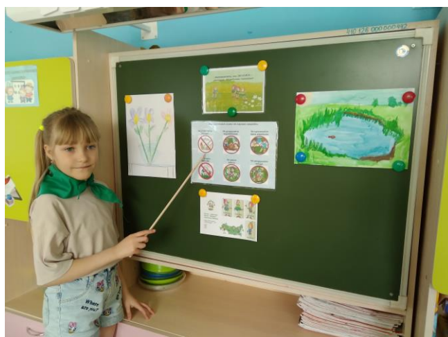
Повторяем правила поведения в лесу