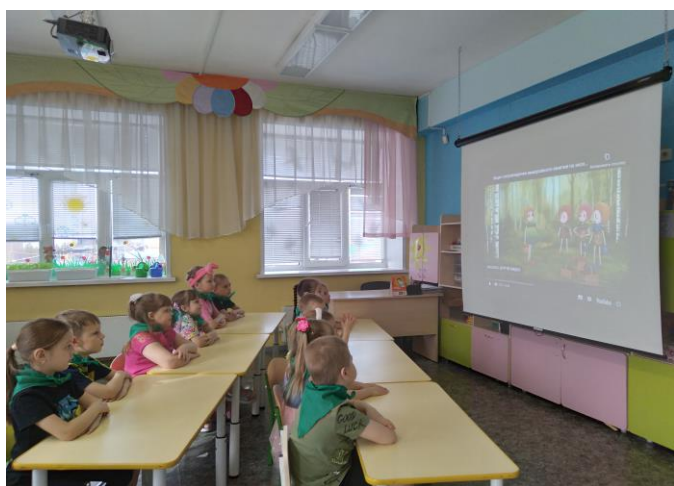
Просмотр презентации «Эколята – защитники природы»