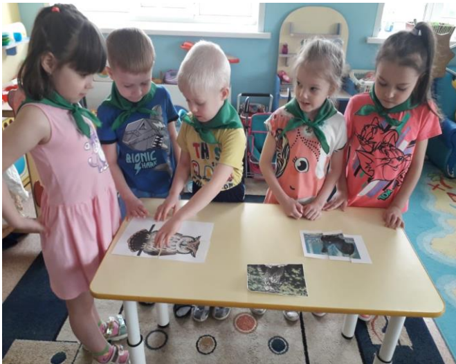
Составляют пазлы "Птицы Кузбасса"