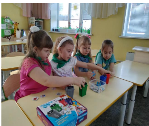
Настольные игра «Сортировка мусора»