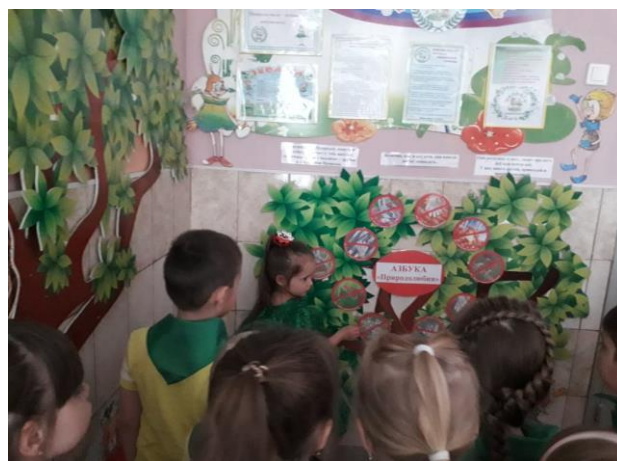
Закрепили природоохранные знаки «Правила поведения в лесу»