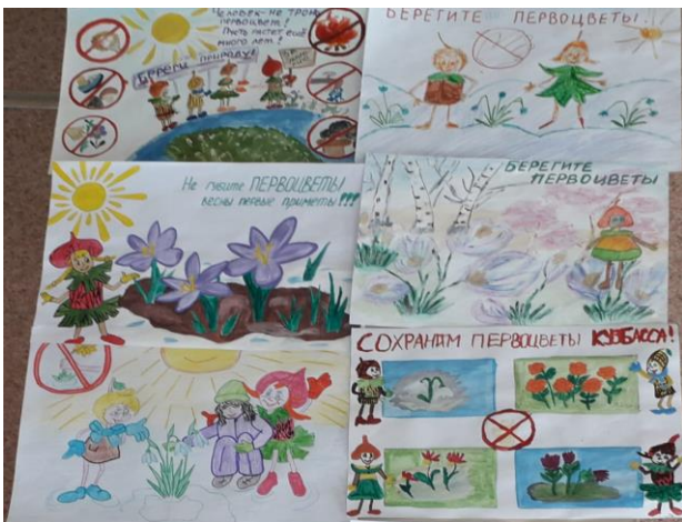
Конкурс рисунков «Эколята охраняют природу»